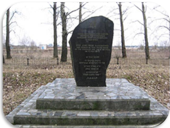
Могила жертв фашизма, узников гетто.