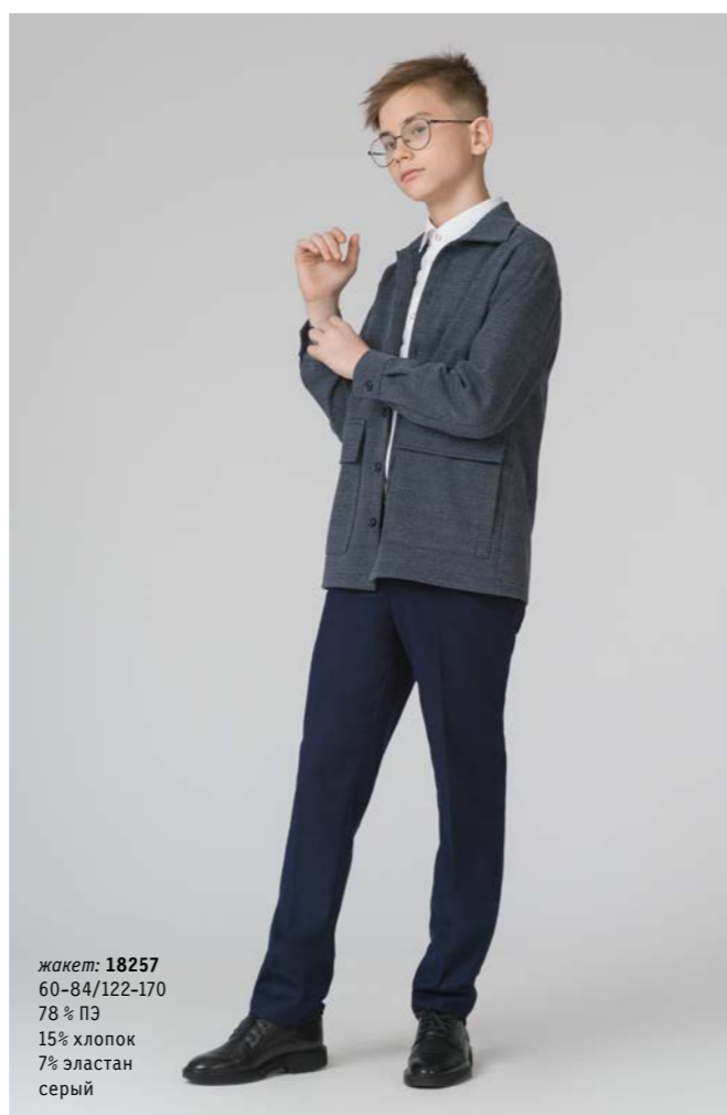
жакет: 18257 60-84/122-170 78% ПЭ 15% хлопок 7% эластан серый