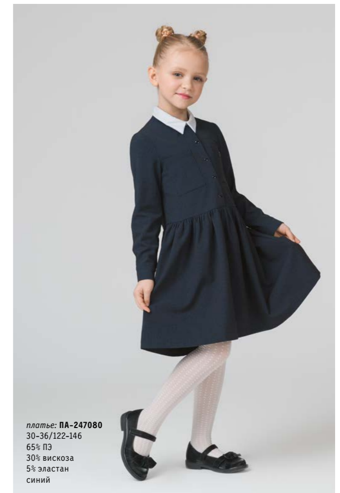
платье: ПА-247080 30-36/122-146 65% ПЭ 30% вискоза 5% эластан синий