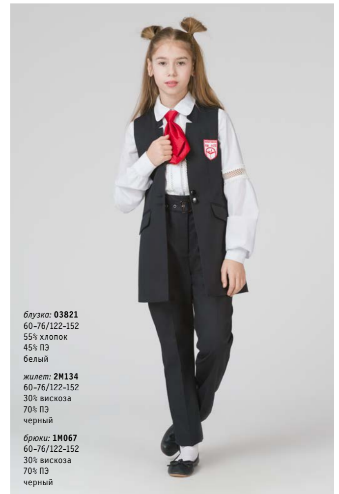
блузка: 03821 60-76/122-152 55% хлопок 45% ПЭ белый жилет: 2M134 60-76/122-152 30% вискоза 70% ПЭ черный брюки: 1M067 60-76/122-152 30% вискоза 70% ПЭ черный