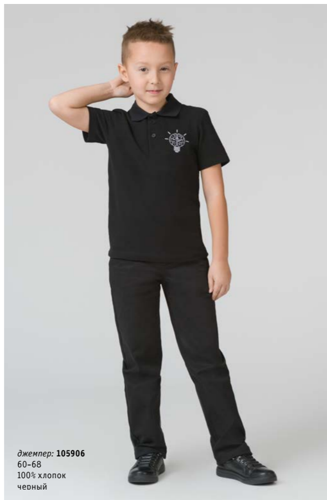
джерсер: 105906 60-68 100% хлопок черный