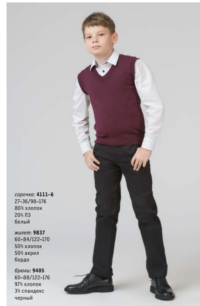
сорочка: 4111-6 27-36/98-176 80% хлопок 20% ПЭ белый жилет: 9837 60-84/122-170 50% хлопок 50% акрил бордо брюки: 9405 60-88/122-176 97% хлопок 3% спандекс черный