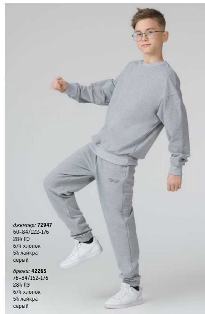
джерсер: 72947 60-84/122-176 28% ПЭ 67% хлопок 5% лайкра серый брюки: 42265 76-84/152-176 28% ПЭ 67% хлопок 5% лайкра серый