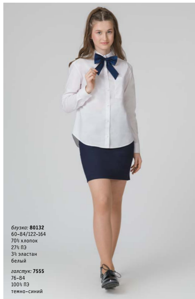
блузка: 80132 60-84/122-164 70% хлопок 27% ПЭ 3% эластан белый галстук: 7555 76-84 100% ПЭ темно-синий