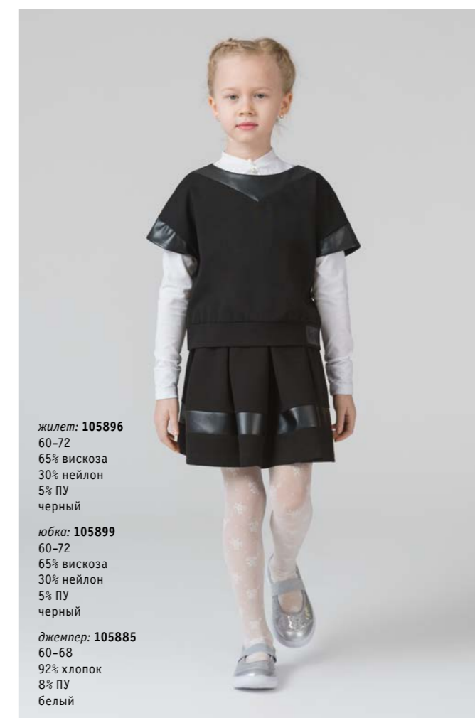
жилет: 105896 60-72 65% вискоза 30% нейлон 5% ПУ черный юбка: 105899 60-72 65% вискоза 30% нейлон 5% ПУ черный джемпер: 105885 60-68 92% хлопок 8% ПУ белый