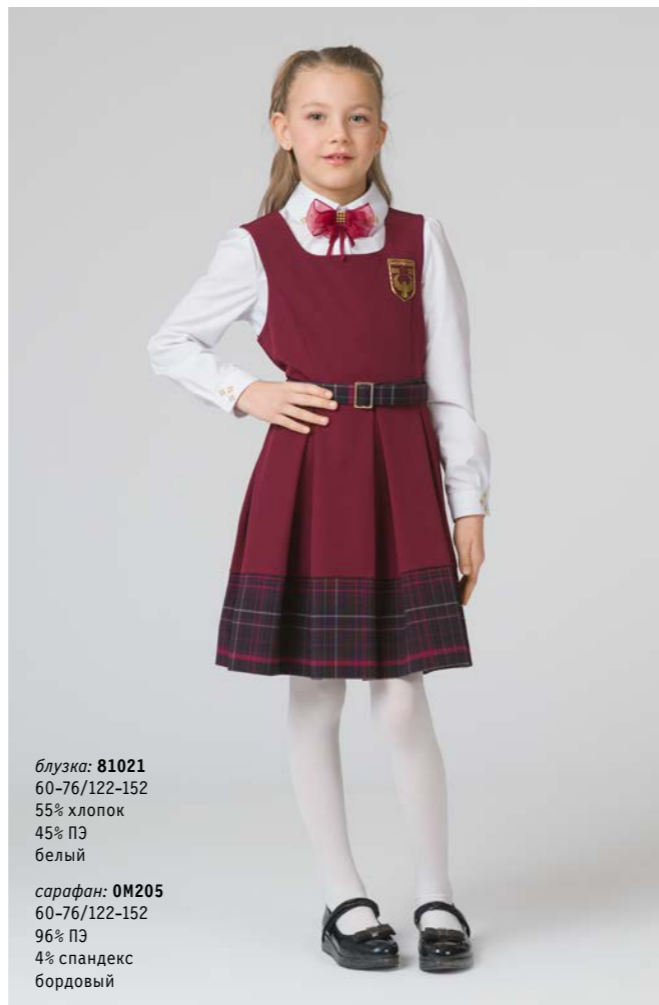
блузка: 81021 60-76/122-152 55% хлопок 45% ПЭ белый сарафан: 0M205 60-76/122-152 96% ПЭ 4% спандекс бордовый

Изделия дополнены шевронами и декоративными элементами в виде бабочки и галстука .