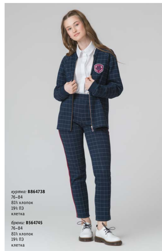
куртка: B864738 76-84 81% хлопок 19% ПЭ клетка