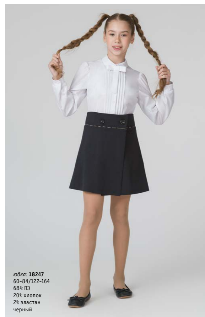
юбка: 18247 60-84/122-164 68% ПЭ 20% хлопок 2% эластан черный