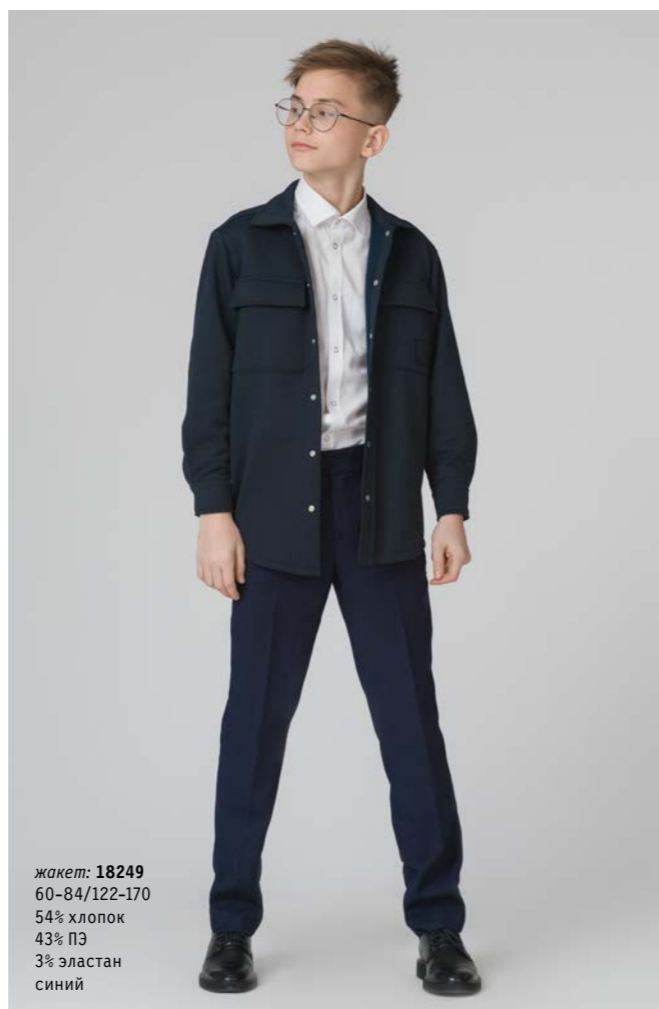
жакет: 18249 60-84/122-170 54% хлопок 43% ПЭ 3% эластан синий

Школьная коллекция ОАО «8 Марта» разработана для стильных и гармоничных учеников. Отличается современным дизайном, комфортом, сочетанием в одежде урбанистической культуры, «взрослой деловой» классики и элементов подростковой непосредственности. Коллекция включает как деловую одежду для школы "School", так и спортивную «Физ-ра».