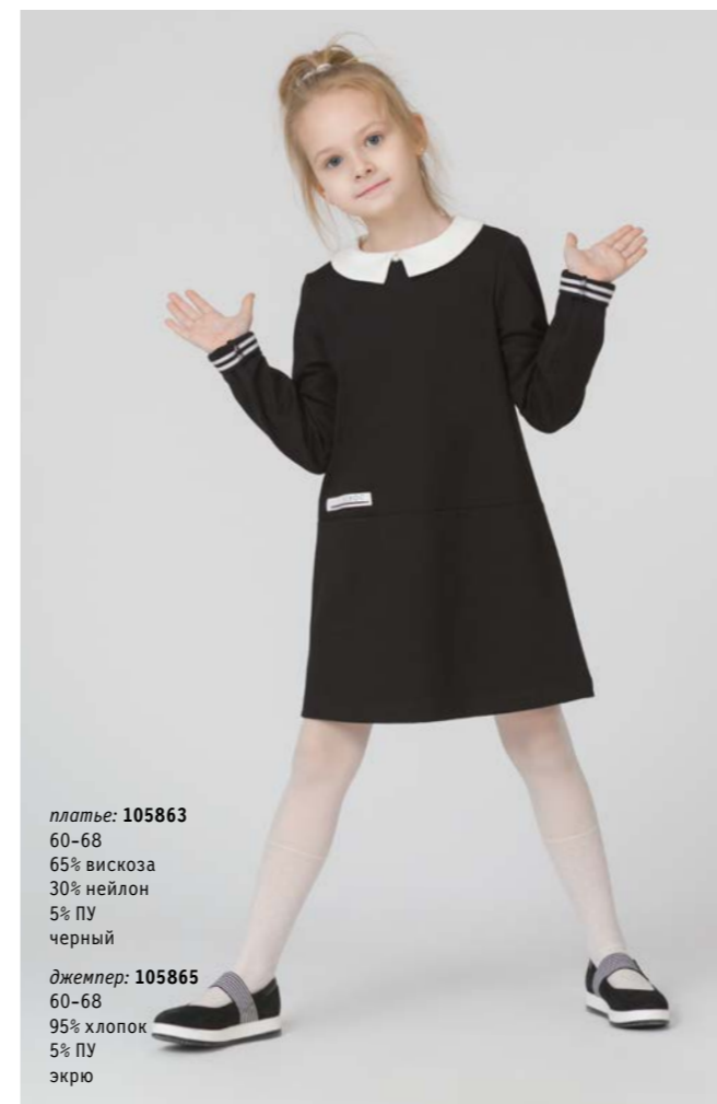
платье: 105863 60-68 65% вискоза 30% нейлон 5% ПУ черный