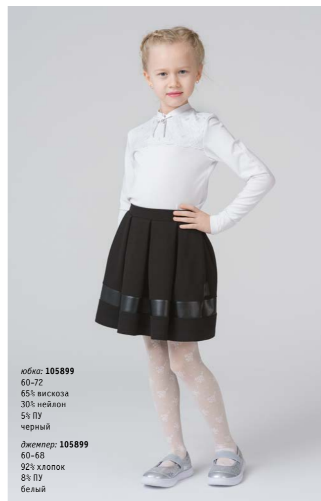
юбка: 105899 60-72 65% вискоза 30% нейлон 5% ПУ черный джемпер: 105899 60-68 92% хлопок 8% ПУ белый