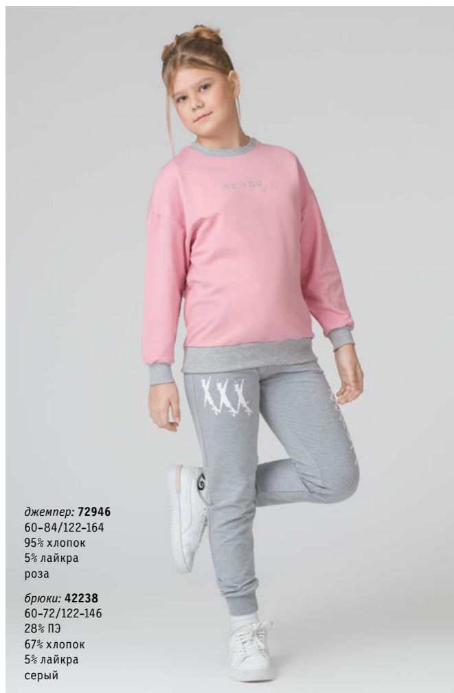
джерсер: 72946 60-84/122-164 95% хлопок 5% лайкра роза брюки: 42238 60-72/122-146 28% ПЭ 67% хлопок 5% лайкра серый