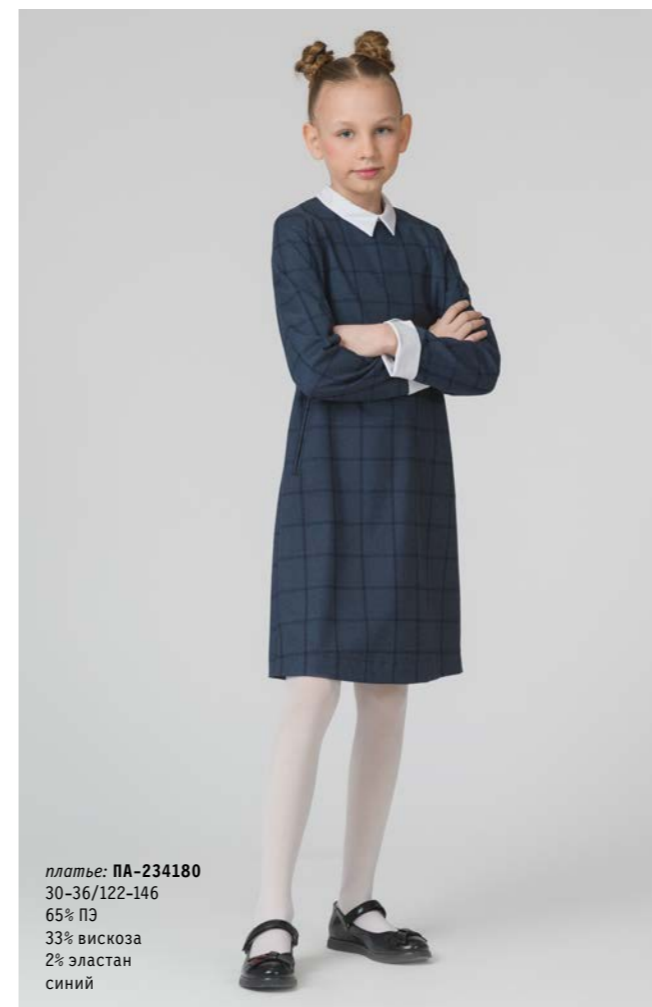
платье: ПА-234180 30-36/122-146 65% ПЭ 33% вискоза 2% эластан синий