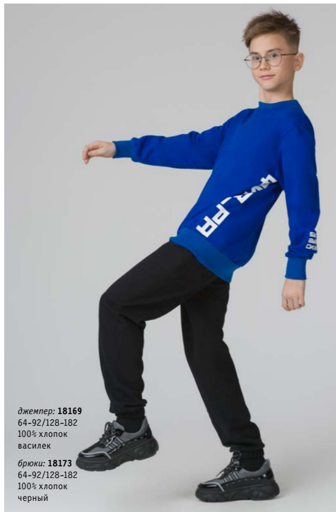
джерсер: 18169 64-92/128-182 100% хлопок василек