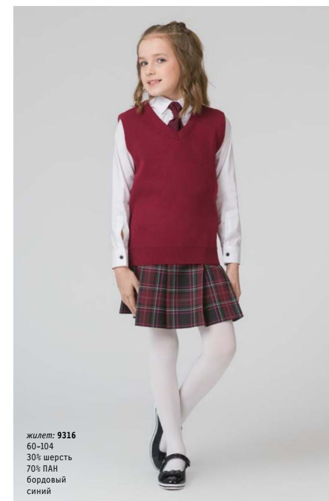
жилет: 9316 60-104 30% шерсть 70% ПАН бордовый синий