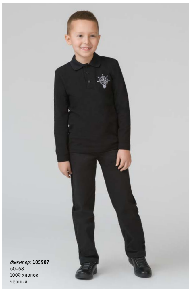
джерсер: 105907 60-68 100% хлопок черный