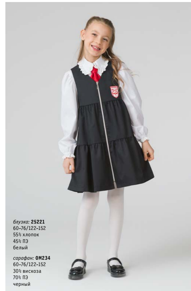
блузка: 25221 60-76/122-152 55% хлопок 45% ПЭ белый сарафан: 0M234 60-76/122-152 30% вискоза 70% ПЭ черный