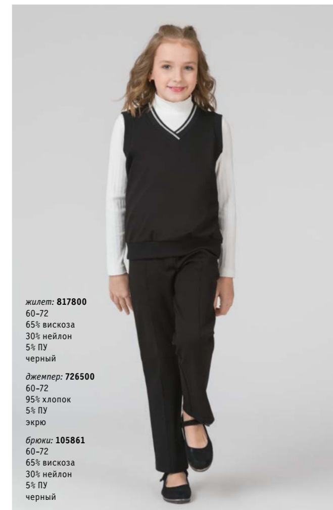
жилет: 817800 60-72 65% вискоза 30% нейлон 5% ПУ черный