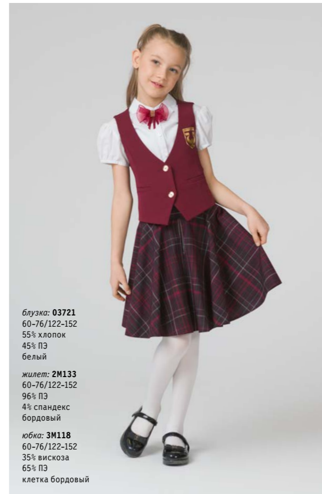
блузка: 03721 60-76/122-152 55% хлопок 45% ПЭ белый жилет: 2M133 60-76/122-152 96% ПЭ 4% спандекс бордовый юбка: 3M118 60-76/122-152 35% вискоза 65% ПЭ клетка бордовый