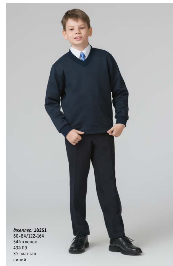
джерсер: 18251 60-84/122-164 54% хлопок 43% ПЭ 3% эластан синий