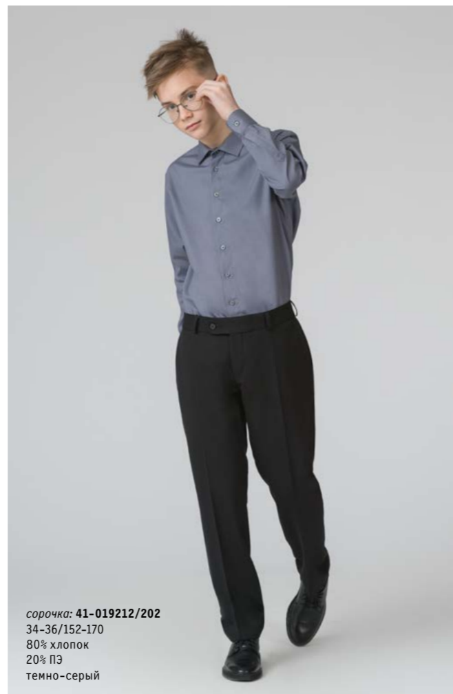
сорочка: 41-019212/202 34-36/152-170 80% хлопок 20% ПЭ темно-серый