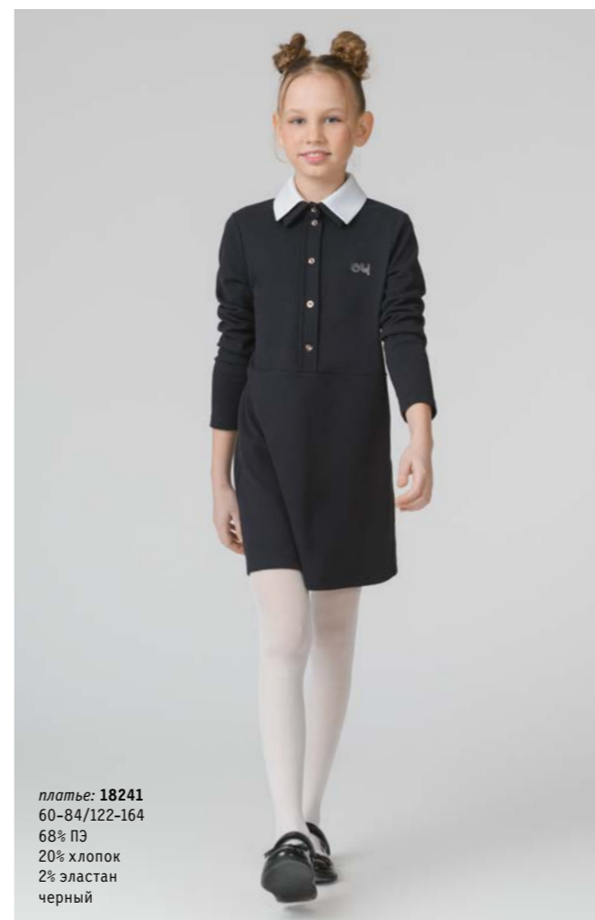
платье: 18241 60-84/122-164 68% ПЭ 20% хлопок 2% эластан черный