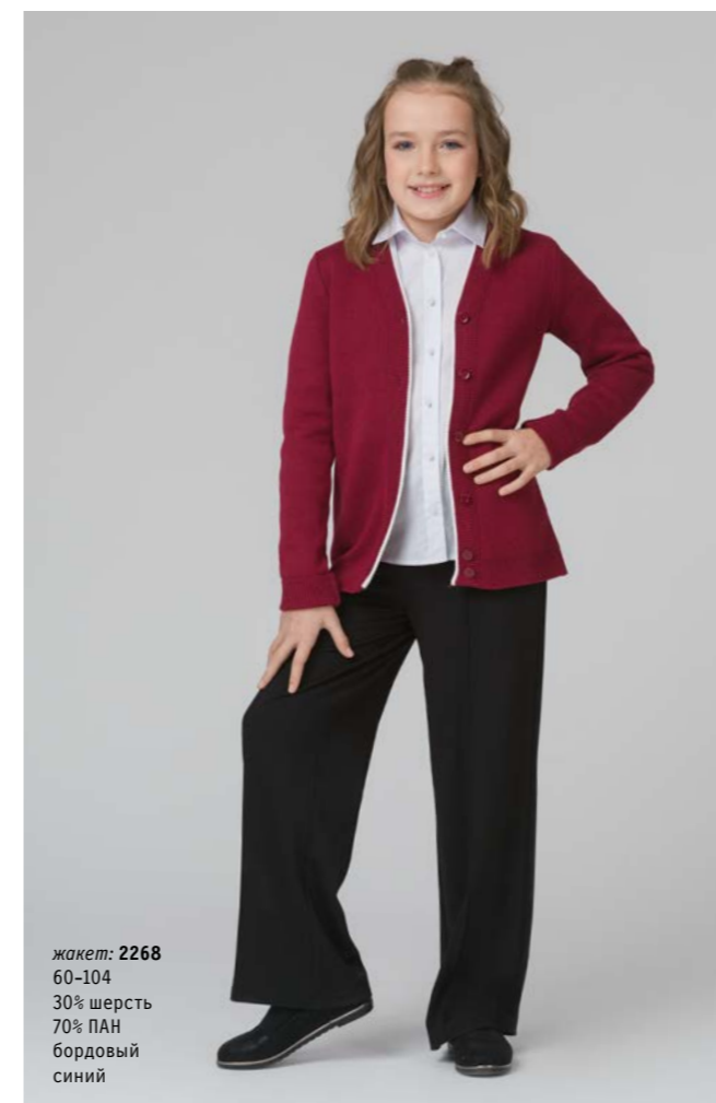
жакет: 2268 60-104 30% шерсть 70% ПАН бордовый синий

Коллекция состоит из изделий для девочек и мальчиков в классических расцветках. Правильный крой и эластичные ткани идеально подходят на любую комплекцию и помогают правильно расставлять акценты. Безупречное качество делает одежду удобной и практичной в ежедневной носке.