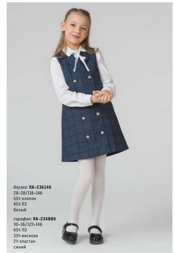
блузка: ПА-236140 28-38/116-146 55% хлопок 45% ПЭ белый сарафан: ПА-234880 30-36/122-146 65% ПЭ 33% вискоза 2% эластан синий