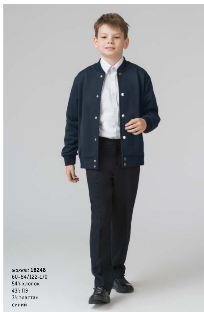
жакет: 18248 60-84/122-170 54% хлопок 43% ПЭ 3% эластан синий