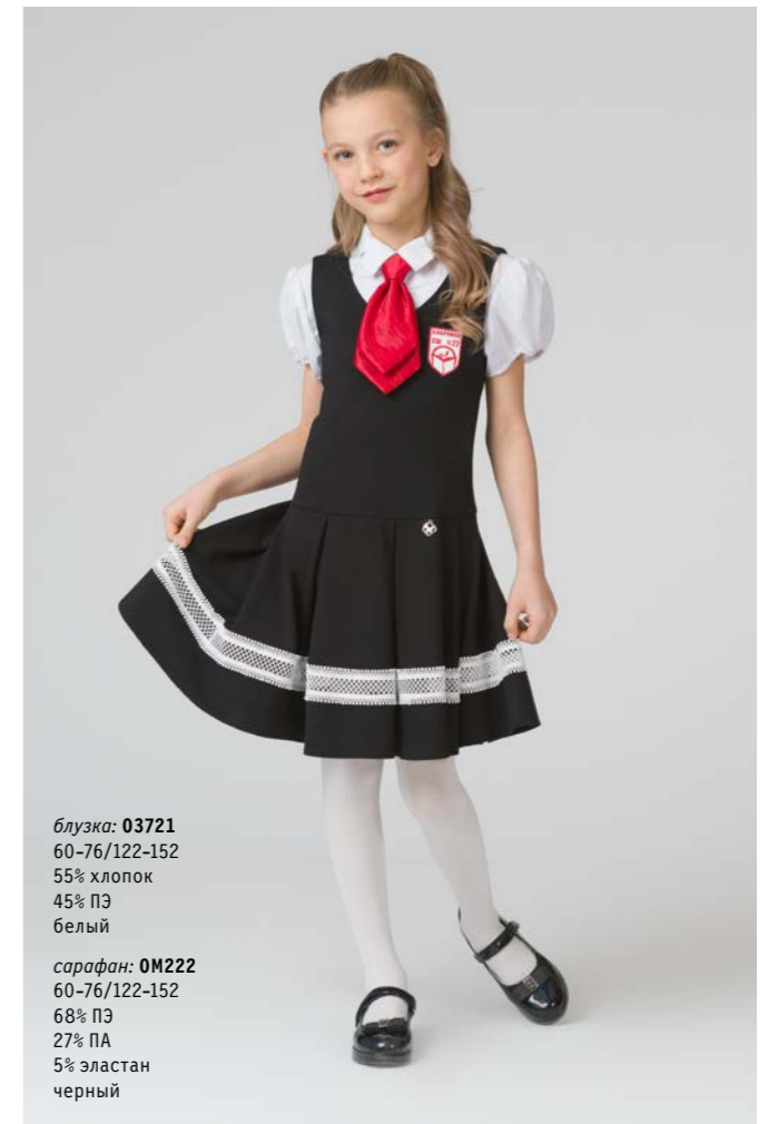
блузка: 03721 60-76/122-152 55% хлопок 45% ПЭ белый сарафан: 0M222 60-76/122-152 68% ПЭ 27% ПА 5% эластан черный