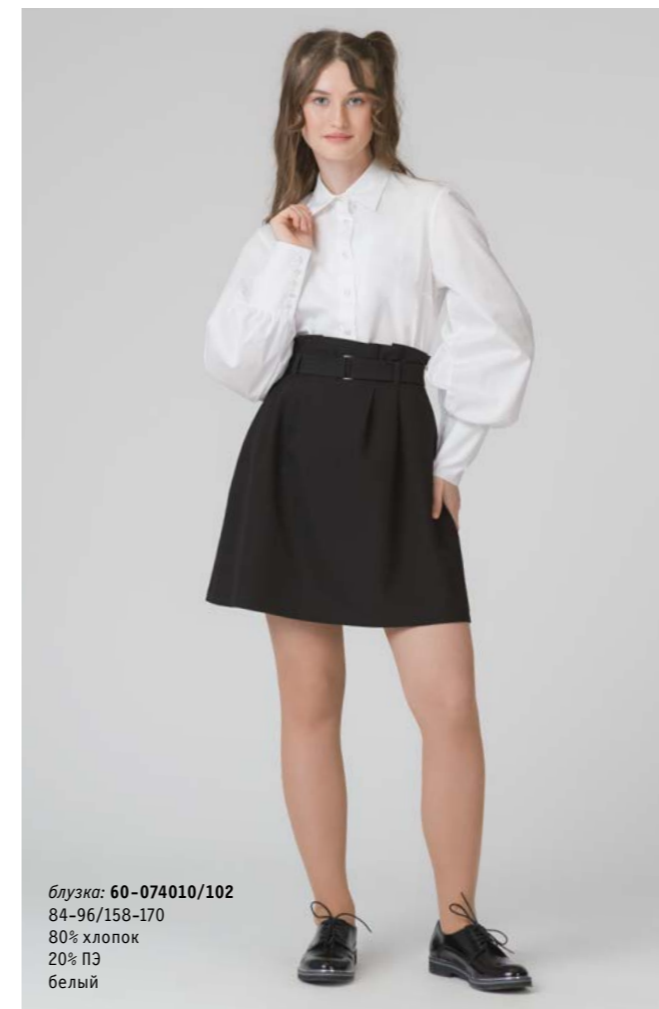
блузка: 60-074010/102 84-96/158-170 80% хлопок 20% ПЭ белый