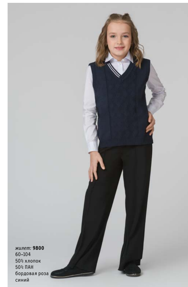
жилет: 9800 60-104 50% хлопок 50% ПАН бордовая роза синий