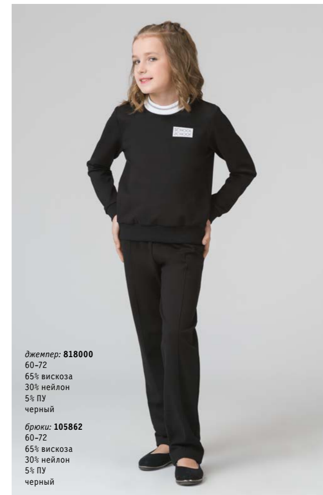
джерсер: 818000 60-72 65% вискоза 30% нейлон 5% ПУ черный