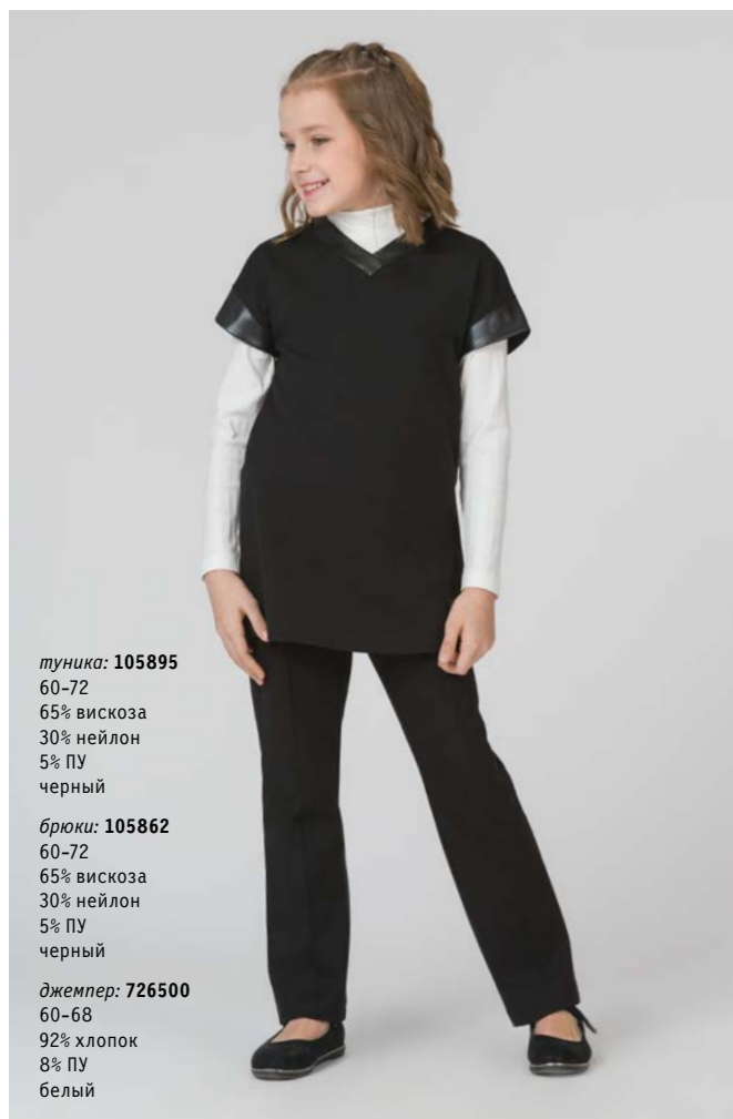
туника: 105895 60-72 65% вискоза 30% нейлон 5% ПУ черный