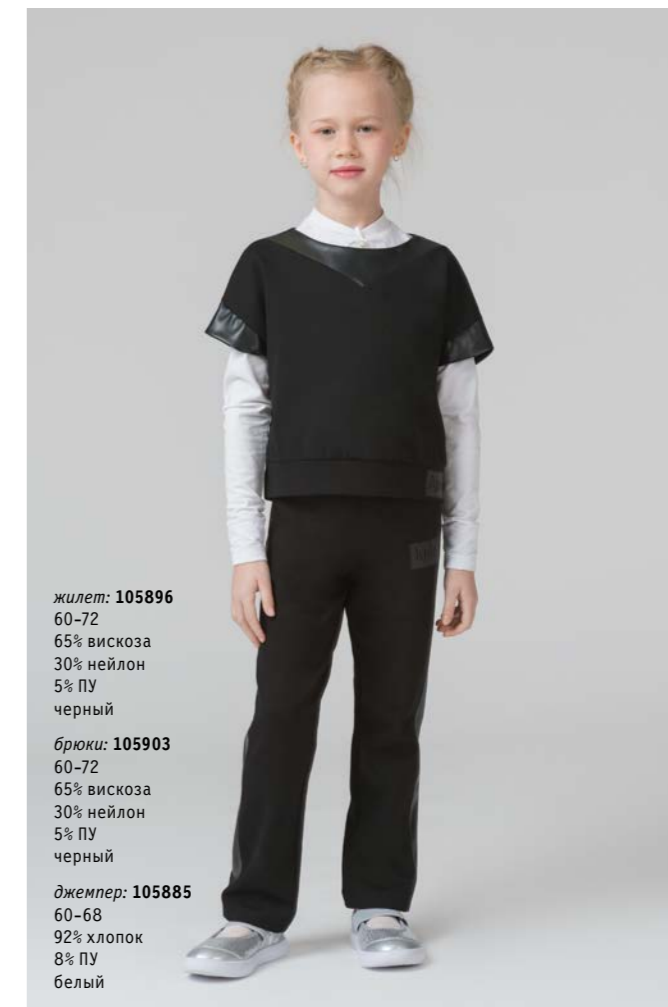
жилет: 105896 60-72 65% вискоза 30% нейлон 5% ПУ черный брюки: 105903 60-72 65% вискоза 30% нейлон 5% ПУ черный джемпер: 105885 60-68 92% хлопок 8% ПУ белый