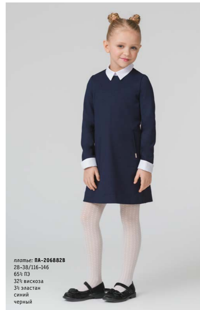
платье: ПА-206882В 28-38/116-146 65% ПЭ 32% вискоза 3% эластан синий черный

Коллекция выполнена из классической для школьной моды ткани на основе хлопка с добавлением полимерных волокон для повышения износостойкости и практичности.