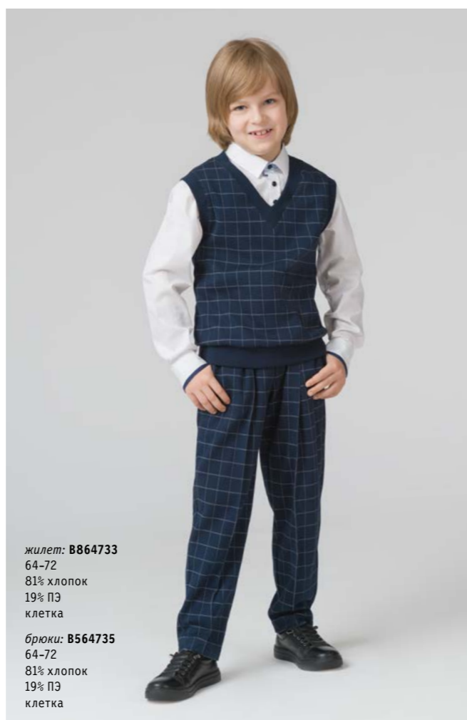
жилет: B864733 64-72 81% хлопок 19% ПЭ клетка

Одежда ОАО «СВІТАНАК» сочетает в себе современность, модный дизайн и высокое качество изделий по доступным ценам. Универсальность наших коллекций позволяет легко и просто комбинировать модели друг с другом и всегда выглядеть стильно и уверенно.