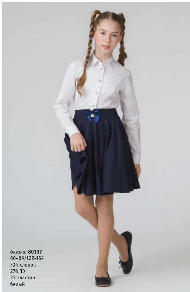
блузка: 80137 60-84/122-164 70% хлопок 27% ПЭ 3% эластан белый