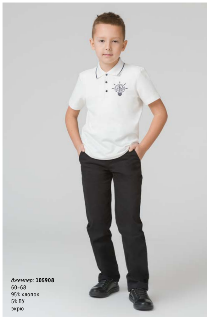
джерсер: 105908 60-68 95% хлопок 5% ПУ экрю