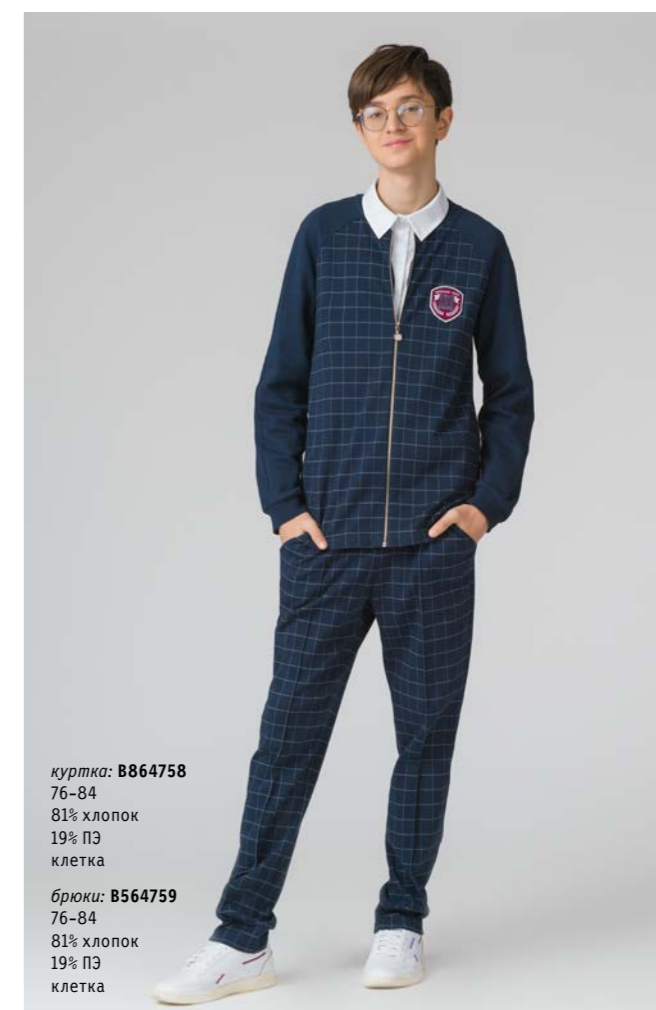
куртка: B864758 76-84 81% хлопок 19% ПЭ клетка