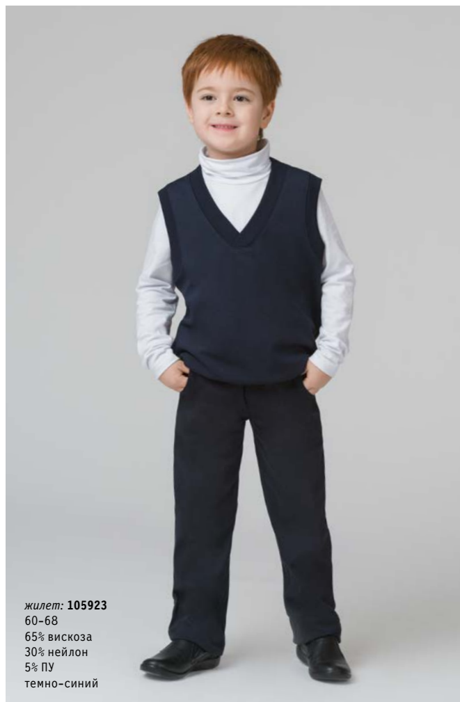
жилет: 105923 60-68 65% вискоза 30% нейлон 5% ПУ темно-синий