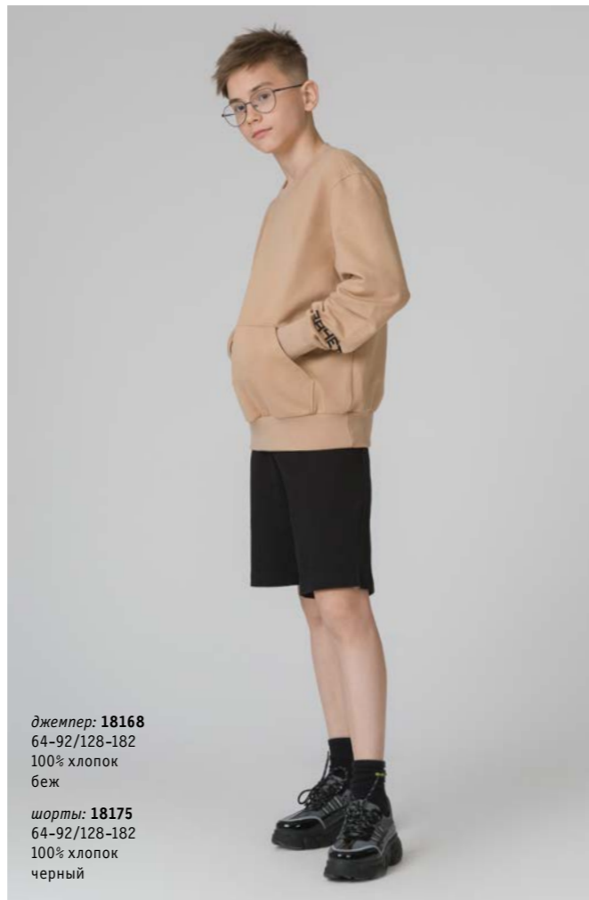
джерсер: 18168 64-92/128-182 100% хлопок беж