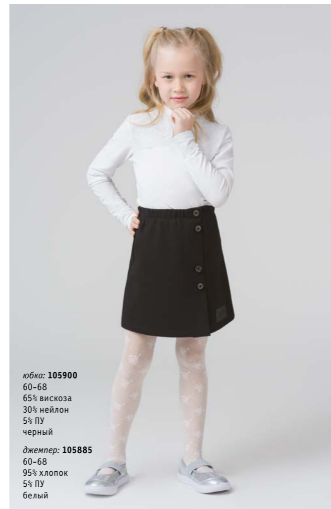
юбка: 105900 60-68 65% вискоза 30% нейлон 5% ПУ черный