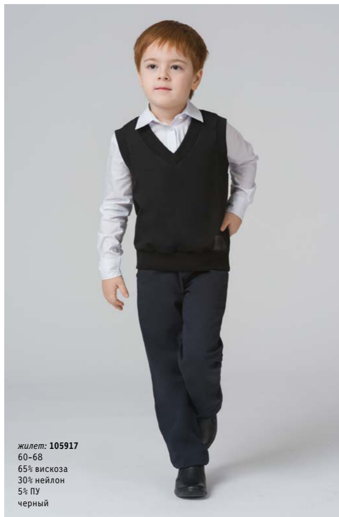
жилет: 105917 60-68 65% вискоза 30% нейлон 5% ПУ черный