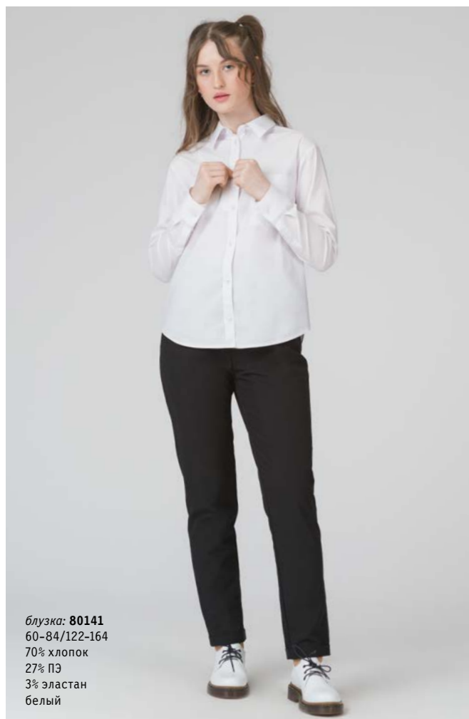
блузка: 80141 60-84/122-164 70% хлопок 27% ПЭ 3% эластан белый

Одежда SILVER GREY – это не просто одежда, а способ поиска своей индивидуальности и самовыражения.