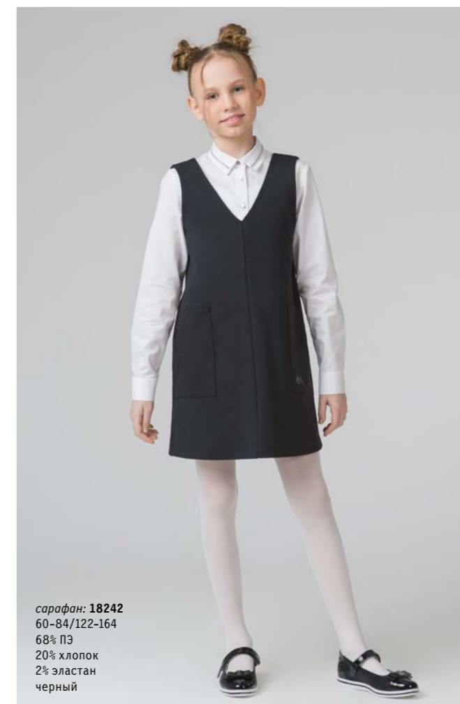
сарфан: 18242 60-84/122-164 68% ПЭ 20% хлопок 2% эластан черный