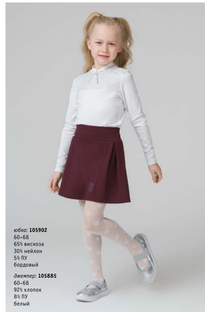
юбка: 105902 60-68 65% вискоза 30% нейлон 5% ПУ бордовый