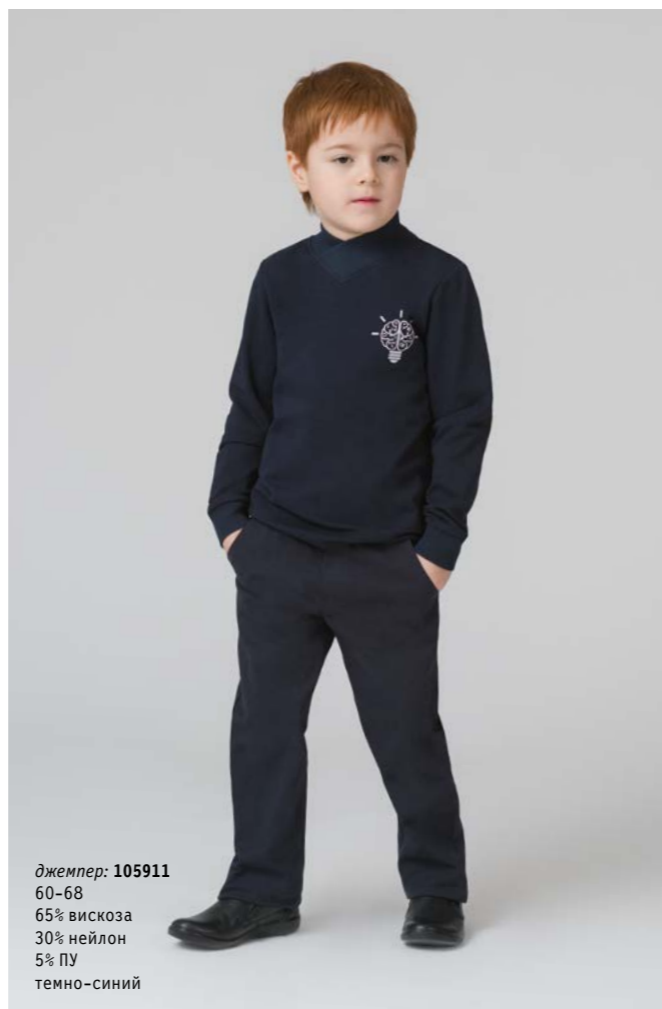
джерсер: 105911 60-68 65% вискоза 30% нейлон 5% ПУ темно-синий