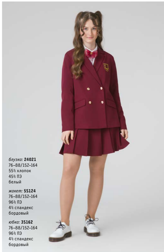
блузка: 24021 76-88/152-164 55% хлопок 45% ПЭ белый жакет: 55124 76-88/152-164 96% ПЭ 4% спандекс бордовый юбка: 3S162 76-88/152-164 96% ПЭ 4% спандекс бордовый