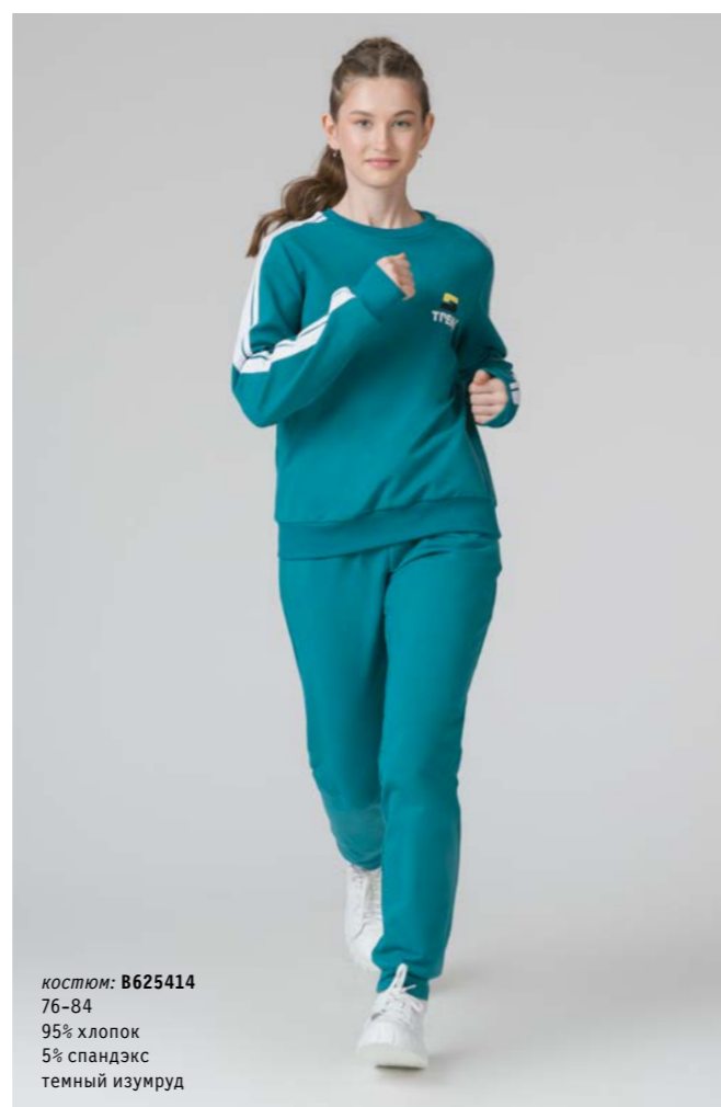
костюм: В625414 76-84 95% хлопок 5% спандэкс темный изумруд

Коллекция представлена актуальными практичными спортивными костюмами. Модели отличаются современным дизайном, удобными конструкциями, полотном, хорошо сохраняющим форму и насыщенность цвета. В качестве отделки используются молнии, канты и штучные печати.