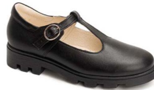
сандалии для первоклашек 44592 170–200