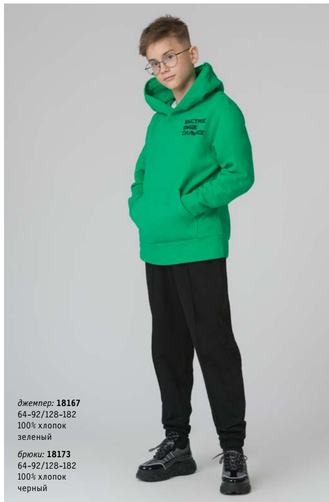
джерсер: 18167 64-92/128-182 100% хлопок зеленый