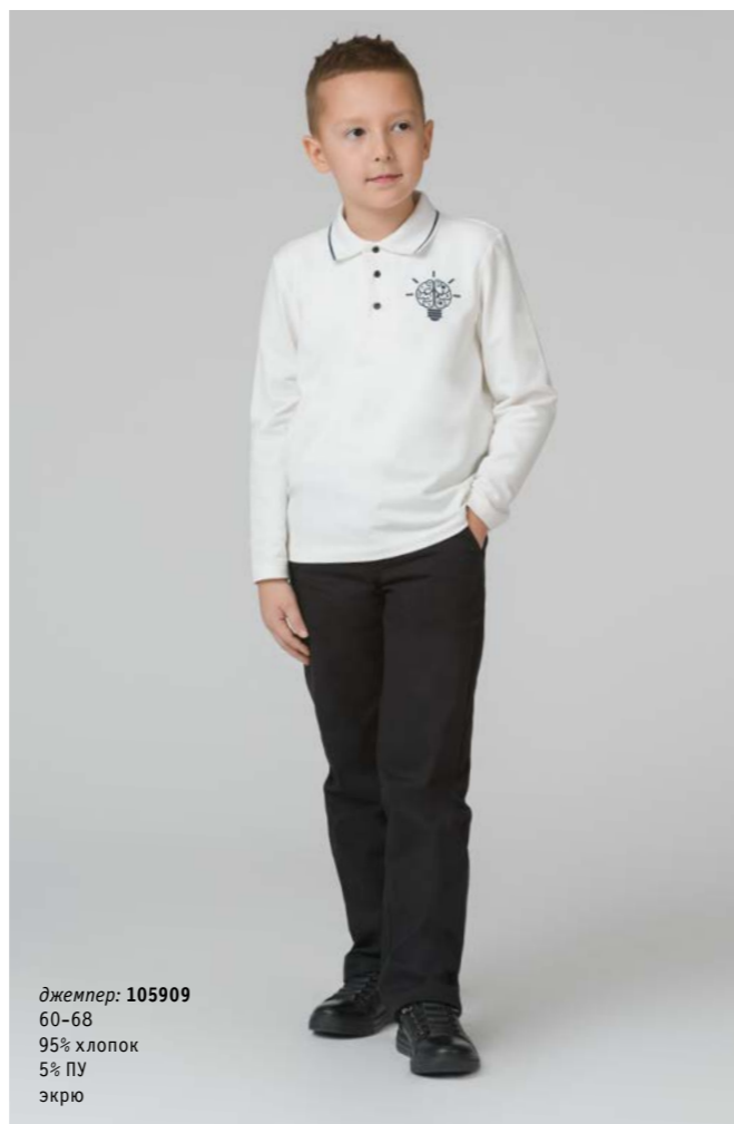
джерсер: 105909 60-68 95% хлопок 5% ПУ экрю