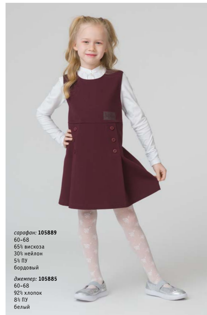
сарафан: 105889 60-68 65% вискоза 30% нейлон 5% ПУ бордовый