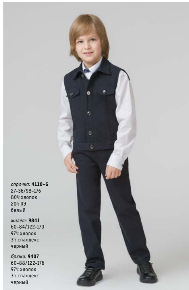
сорочка: 4110-6 27-36/98-176 80% хлопок 20% ПЭ белый жилет: 9841 60-84/122-170 97% хлопок 3% спандекс черный брюки: 9407 60-88/122-176 97% хлопок 3% спандекс черный