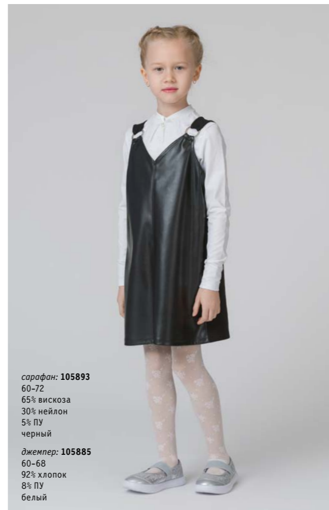
сарафан: 105893 60-72 65% вискоза 30% нейлон 5% ПУ черный джемпер: 105885 60-68 92% хлопок 8% ПУ белый

В школьной коллекции ОАО «КУПАЛИНКА» представлены джемпера в сочетании с сарафанами, жилетами, брюками, юбками, а также платьями базового кроя из трикотажных полотен. Модели имеют максимально простой и лаконичный дизайн: выполнены в строгой гамме, имеют прямой силуэт. Трикотажные джемпера – отличный вариант на каждый день. Каждый из них одинаково хорошо сочетается как с классическими моделями, так и с выполненными в спортивном стиле.