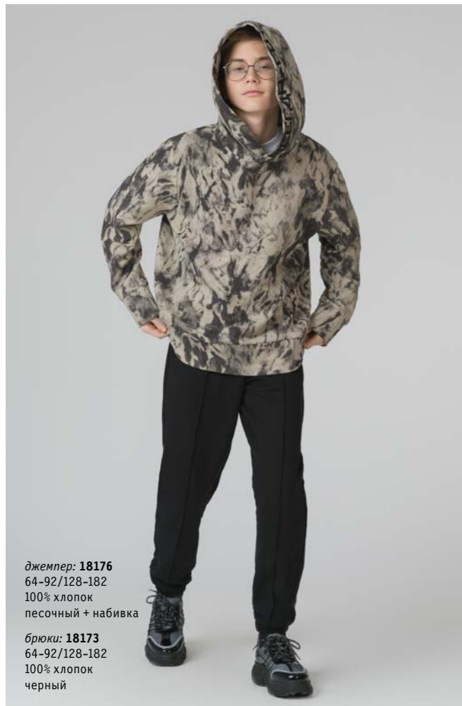
джерсер: 18176 64-92/128-182 100% хлопок песочный + набивка