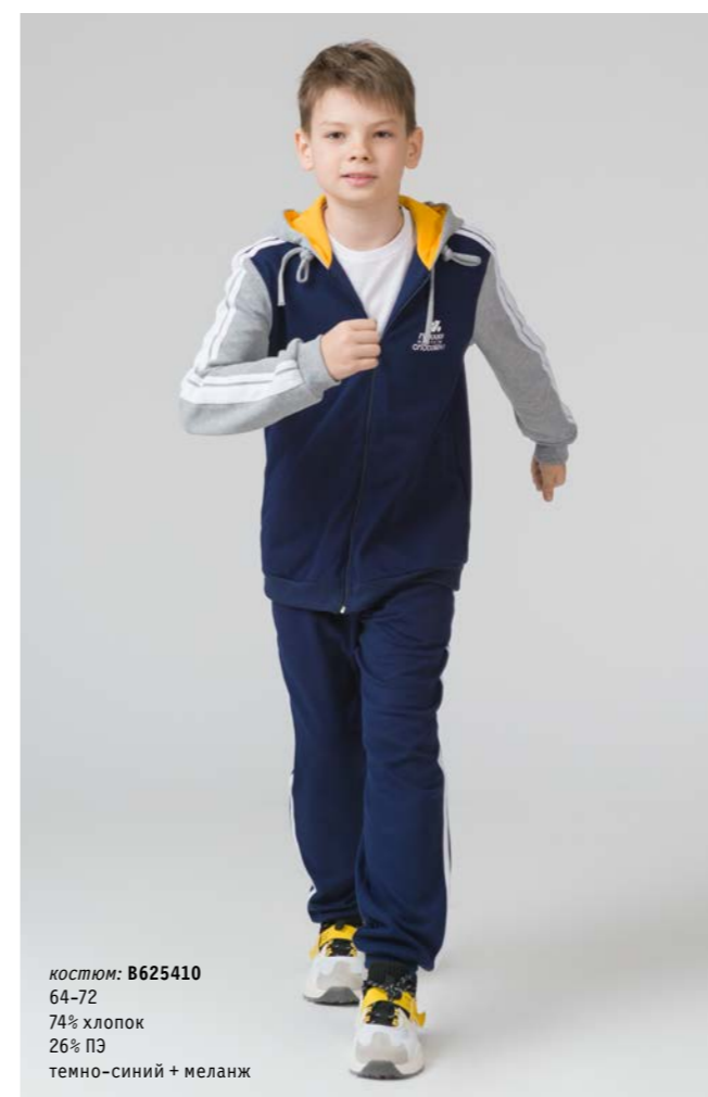
костюм: В625410 64-72 74% хлопок 26% ПЭ темно-синий + меланж